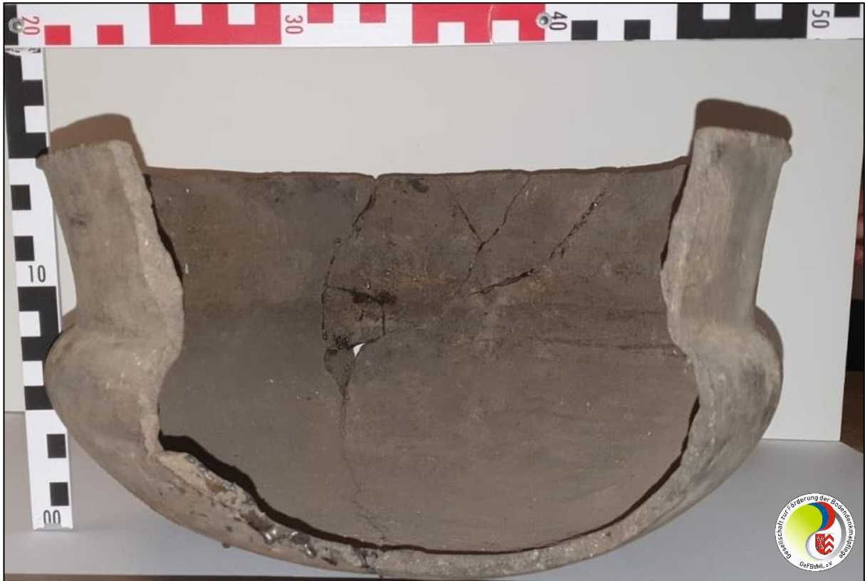
Seitenansicht, fragmentierter Bereich, ©K. Benseler/GeFBdML e.V.