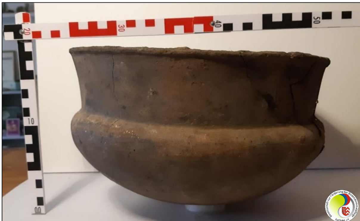
Seitenansicht, mit Maßstäben oben und seitlich