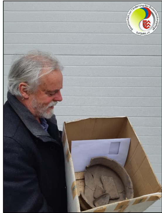
F. Raute mit d. Urne