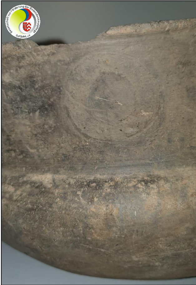
Detailansicht „Verzierung“