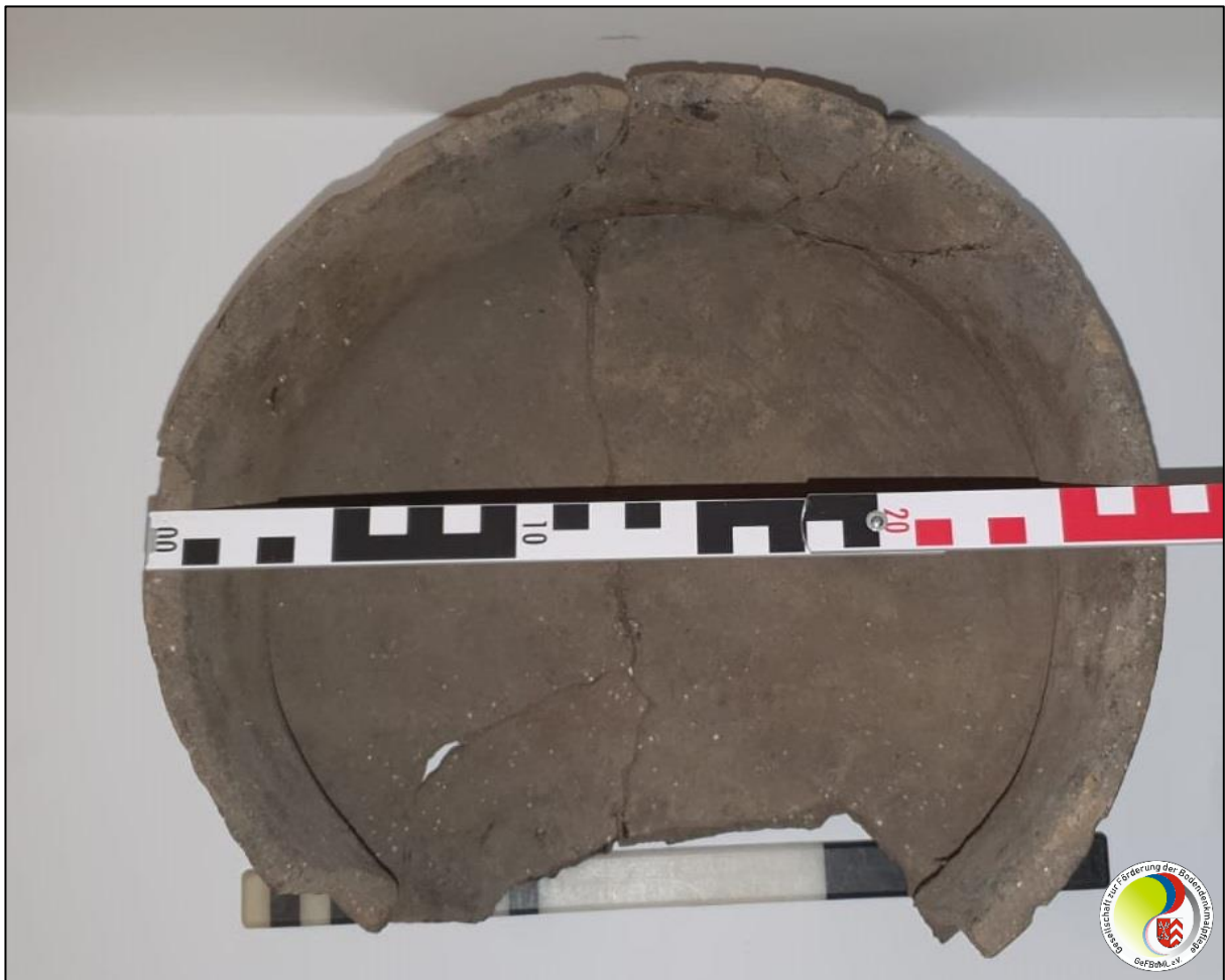
Ansicht von oben